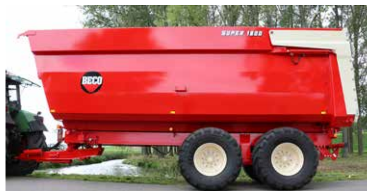
SUPER 1800 XPERT silagekipper. Speciale laadbak 7.000 x 2.250 x 2.200 (34,7 m 2 waterinhoud). De zijwanden zijn uit 1 geheel gemaakt.

BECO ontwikkelt kipwagens dóór de praktijk, vóór de praktijk, in overleg met dealers en eindgebruikers. Dit heeft bijvoorbeeld al geleid tot onder andere diverse silage- en baggerkippers. Informeer bij uw dealer naar de mogelijkheden.