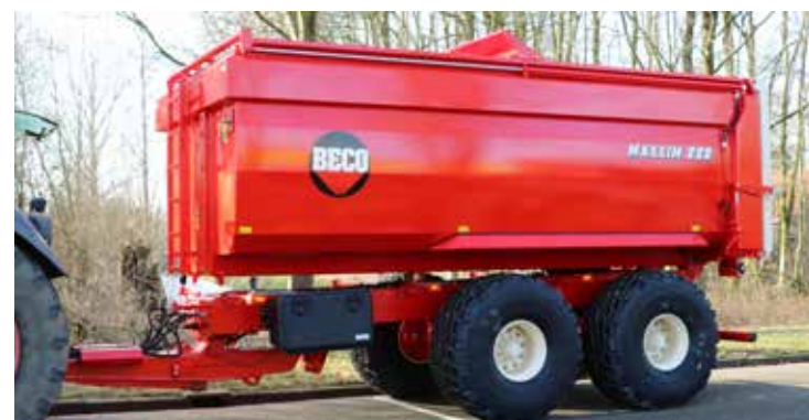
MAXXIM 220 XPERT baggerkipper. Bovenzijde afgedicht met hydraulisch schuifluik. Achterklep met rubber afdichtprofiel en 4 hydraulisch bediende sluitthaken.