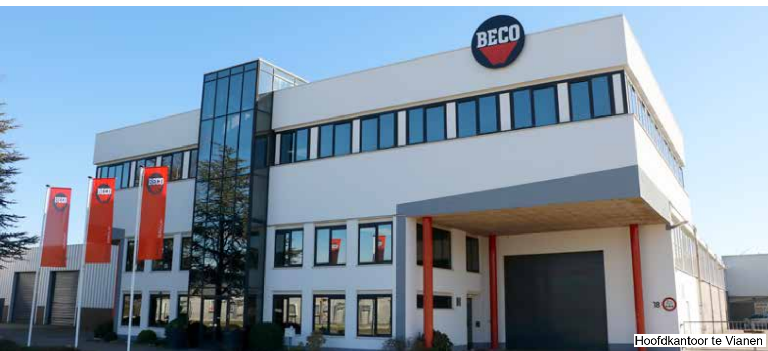
Hoofdkantoor te Vianen